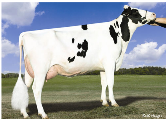
AMMON-PEACHEY SHANA FIFTH DAM